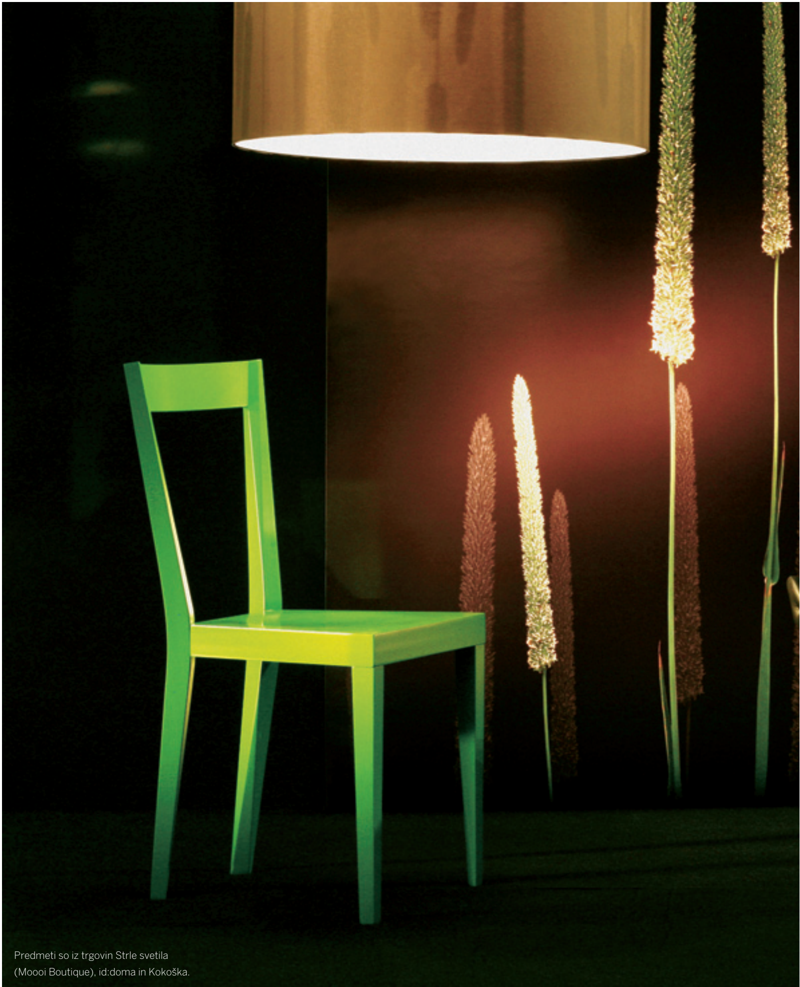
Predmeti so iz trgovin Strle svetila (Moooi Boutique), id:doma in Kokoška.