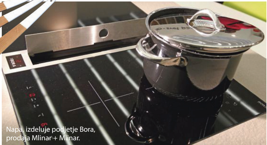
Napa, izdeluje podjetje Bora, prodaja Mlinar + Mlinar.