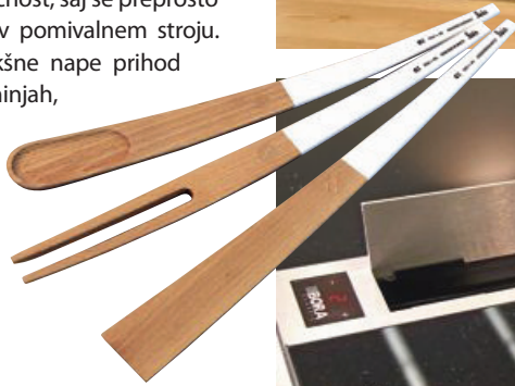
Leseni pribor, oblikovanje Gigodesign, blagovna znamka Leis, izdeluje Rimarket.