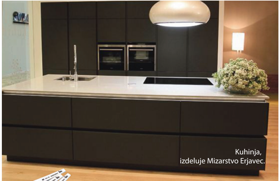
Kuhinja, izdeluje Mizarstvo Erjavec.

Lahkotnost v oblikovanju, tanke linije, na ravna barva, naravni material – les so besede, s katerimi sta pojasnili, zakaj so ju prepričali stol in mizica Vogel ter modularni sistem Mix box blagovne znamke Collignum, ki so ju oblikovali v biroju Trije arhitekti. Kakor pravita, bi se podali v kakšno lepo oblikovano koč, vendar bi jih lahko vključili tudi v minimalistični interior. Stol sta preskusili in ugotovili, da je veliko bolj udoben, kot se zdi na prvi pogled. »Omarica iz kock je zanimiva, ker se lahko razstavlja in na novo oblikuje. Preprosto odvijete lesene vijake, kocke