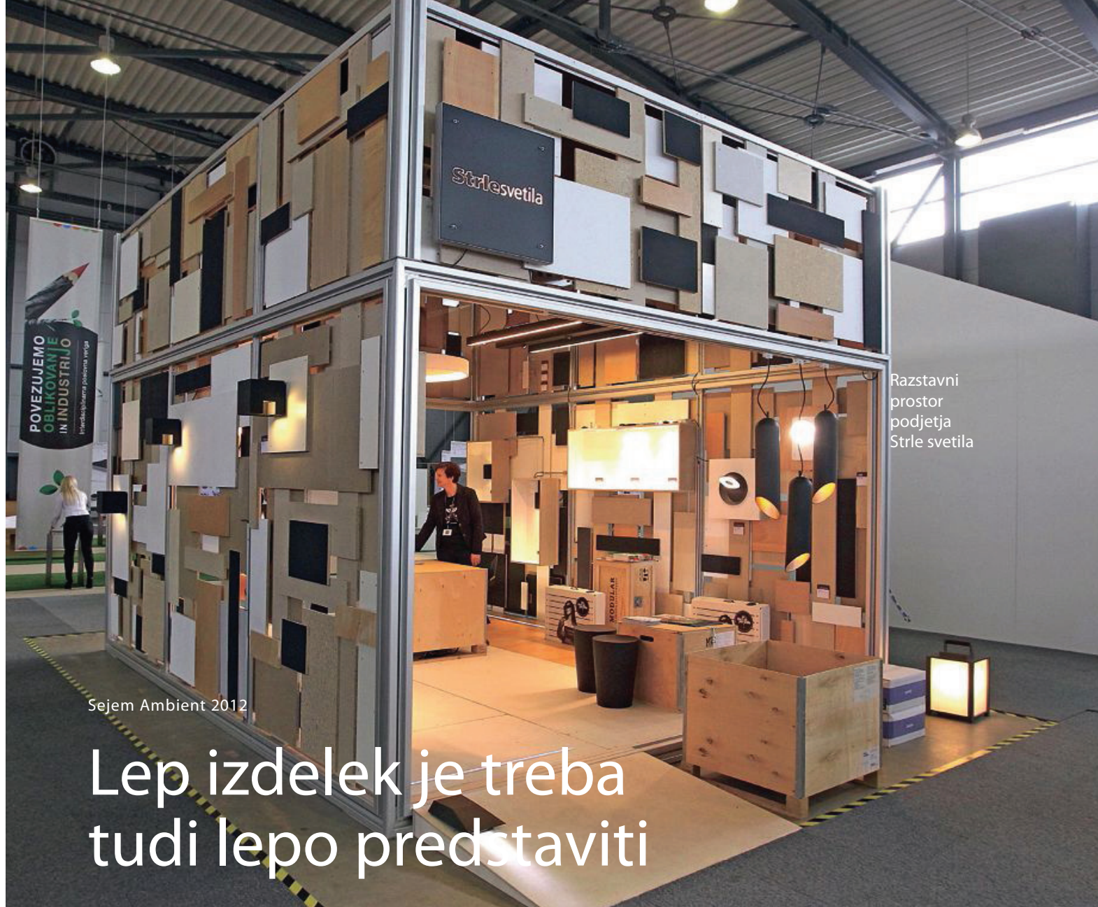
Razstavn prostor podjetja Strle svetila