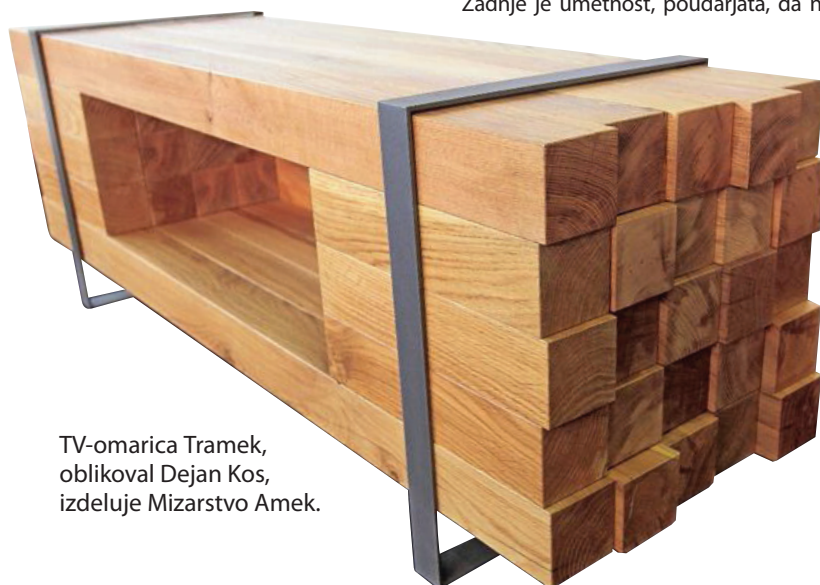
TV-omarica Tramek, oblikoval Dejan Kos, izdeluje Mizarstvo Amek.

Aleksandra Zorko