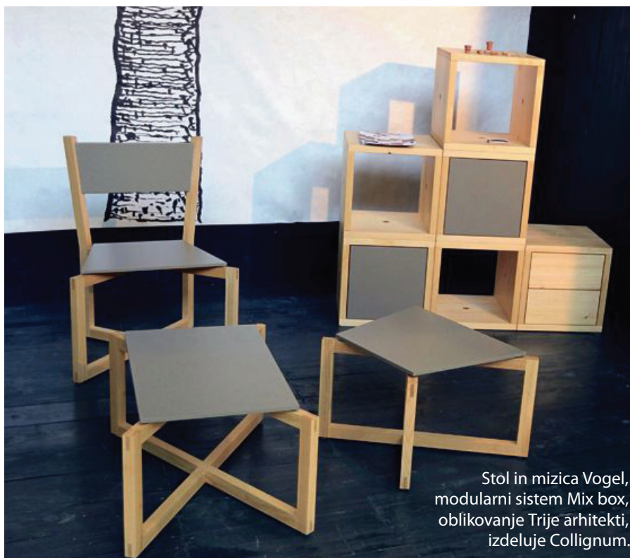
Stol in mizica Vogel, modularni sistem Mix box, oblikovanje Trije arhitekti, izdeluje Collignum.