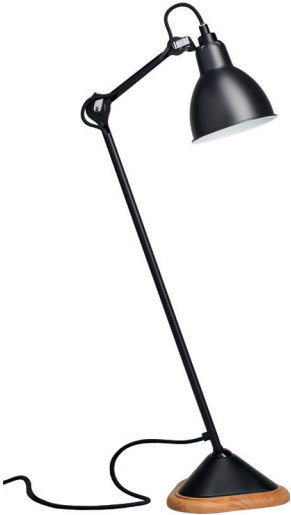
Table lamp | Lampe de table