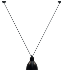
N°323 BL-SAT (SHADE ROUND XL)

Black satin steel | Colored or coppered shade Acier noir satin | Réflecteur couleur ou cuivré